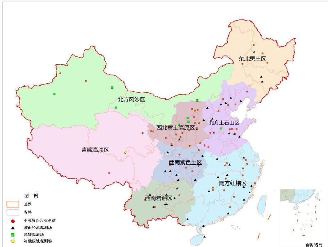
图 5-1 水土保持典型监测点分布图